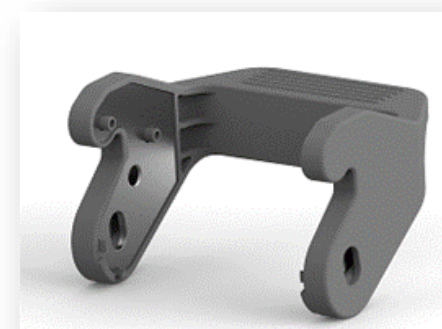
交換用プラスチックロッキングレバー HB Double Plastic Locking

* ロックレバー表面は樹脂製ですが、ロックレバー内部には金属パーツが組み込まれております。