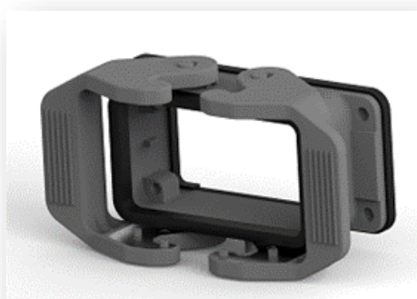
プラスチック ロッキングレバー付きハウジング H10B-AG-SL